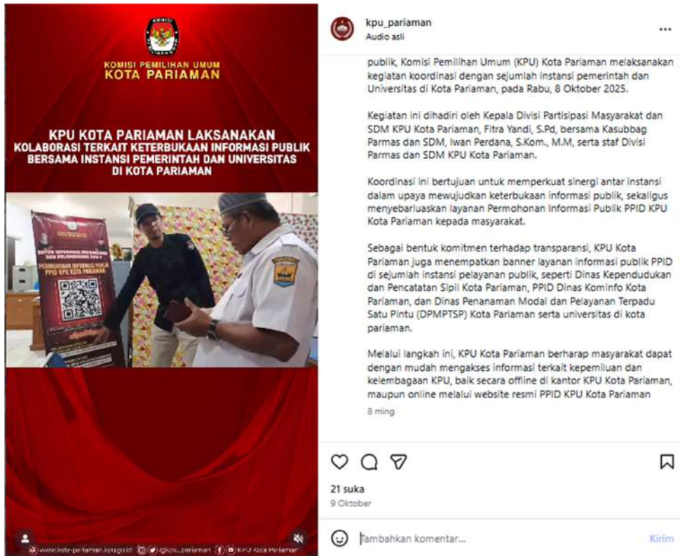
Gambar 3.14 video pendidikan pemilih dalam rangka meningkatkan pelayanan informasi dan memperluas akses masyarakat terhadap keterbukaan informasi publik, Komisi Pemilihan Umum (KPU) Kota Pariaman dalam kegiatan koordinasi dengan sejumlah instansi pemerintah dan Universitas di Kota Pariaman