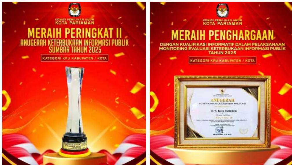
Gambar 3.18 Penghargaan Keterbukaan Informasi oleh Komisi Informasi Sumatera Barat

KPU Kota Pariaman juga mendapatkan Penghargaan Tingkat Nasional Kategori Partisipatory pada Pemilihan Kepala Daerah Serentak Tahun 2024 dari KPU RI. KPU Kota Pariaman menduduki peringkat 2 dari 19 Kabupaten/Kota Se-Sumatera Barat dengan Skor 77,59. Penghargaan ini didasarkan oleh beberapa variabel, yakni: