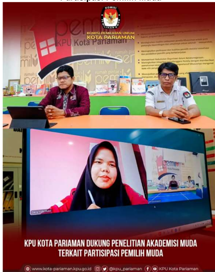
Gambar 3.7 KPU Kota Pariaman dukung Penelitian Akademisi Muda terkait Partisipasi Pemilih Muda