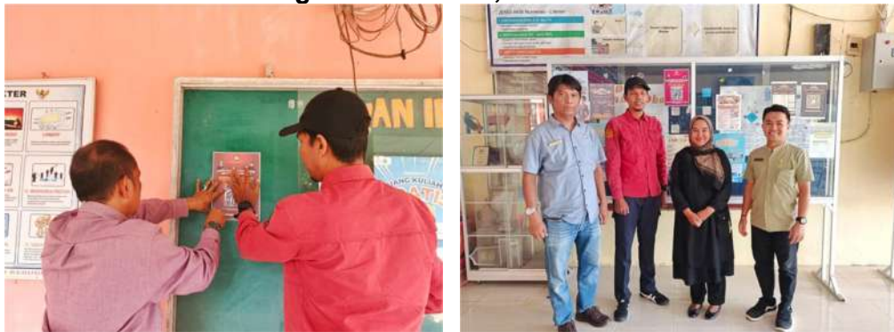
Gambar 3.1 Sosialisasi dan Pendidikan Pemilih di SMA Negeri 1 Pariaman dan SMK Negeri 1 Pariaman, 8 Oktober 2025

Berikut Pendidikan Pemilih dan Penyebaran informasi Pemutakhiran Data Pemilih Berkelanjutan berupa flyer barcode cek data pemilih, dimana melalui Scan barcode, Pemilih akan mengetahui telah terdaftar sebagai pemilih, di SMA Negeri 2 Pariaman dan di SMK Negeri 1 Pariaman.