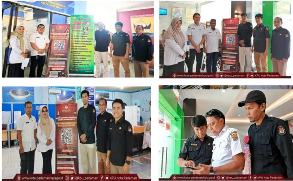
Gambar 3.12 Penyebaran informasi Pendidikan Pemilih dengan Dinas Kependudukan dan Pencatatan Sipil Kota Pariaman, PPID Dinas Kominfo Kota Pariaman, Dinas Penanaman Modal dan Pelayanan Terpadu Satu Pintu (DPMPTSP) Kota Pariaman