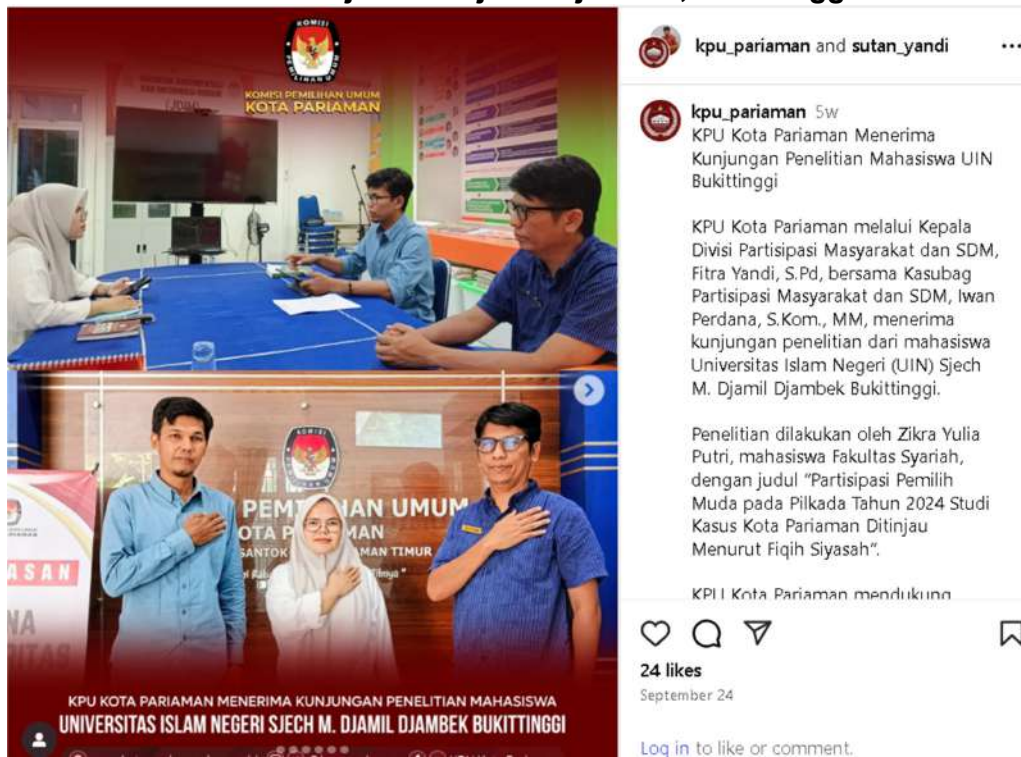
Gambar 3.6 KPU Kota Pariaman menerima kunjungan Penelitian Mahasiswa Universitas Sjech M. Djamil Djambek, Bukittinggi

KPU Kota Pariaman mendukung kegiatan penelitian ini sebagai bagian dari upaya pengembangan ilmu pengetahuan serta peningkatan keterlibatan generasi muda dalam proses demokrasi., Rabu, 24 September 2025.