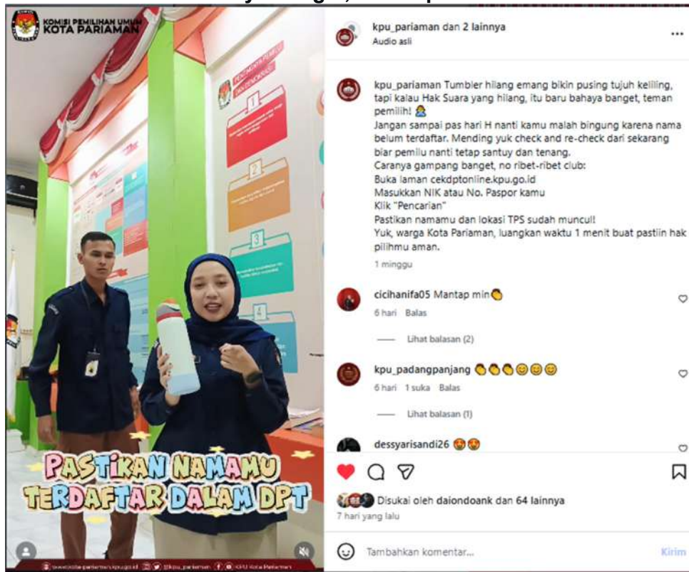
Gambar 3.17 video pendidikan pemilih berupa Tumbler hilang emang bikin pusing tujuh keliling, tapi kalau Hak Suara yang hilang, itu baru bahaya banget, teman pemilih!

Pada Tahun 2025 KPU Kota Pariaman mendapatkan beberapa penghargaan dari Komisi Informasi atas keterbukaan informasi publik di KPU Kota Pariaman. KPU Kota Pariaman meraih Predikat Badan Publik Informatif pada Malam Anugerah Keterbukaan Informasi Publik yang diselenggarakan oleh Komisi Informasi Publik (KI) Sumatera Barat. Pada ajang ini KPU Kota Pariaman juga mendapatkan penghargaan Peringkat Dua Keterbukaan Informasi Publik pada Kategori KPU Kabupaten/Kota.