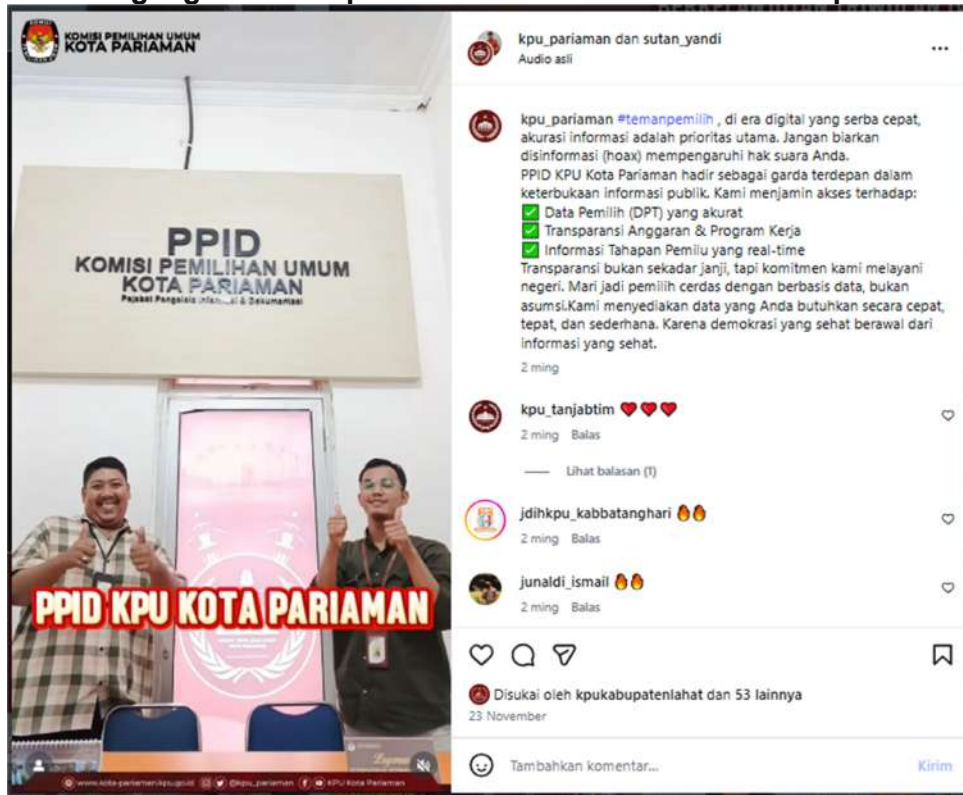
Gambar 3.15 video pendidikan pemilih berupa : PPID KPU Kota Pariaman hadir sebagai garda terdepan dalam keterbukaan informasi publik

d) KPU Kota Pariaman membuat video pendidikan pemilih berupa terus berkomitmen menjaga keakuratan data pemilih melalui Pemutakhiran Data Pemilih Berkelanjutan (PDPB) Triwulan IV. Kegiatan ini adalah upaya institusi untuk memastikan Hak Konstitusional setiap warga Kota Pariaman terjamin dalam Pemilu.