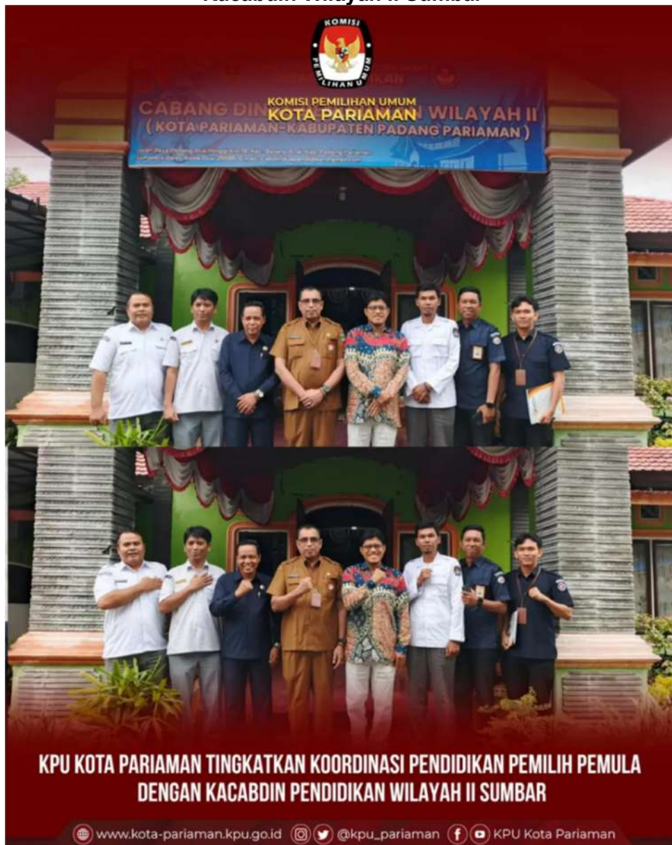
Gambar 3.4 Koordinasi Pendidikan Pemilih Pemula KPU Kota Pariaman dengan Kacabdin Wilayah II Sumbar