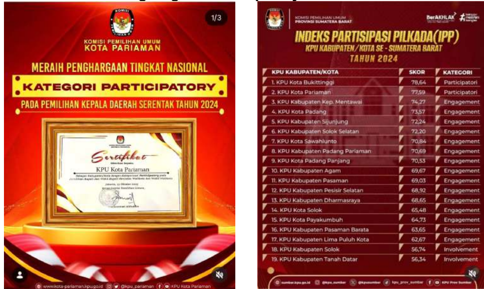
Gambar 3.19 Penghargaan Partisipatory oleh KPU RI

KPU Kota Pariaman pada Tahun 2025 juga mendapatkan Penghargaan oleh Pemerintah Kota Pariaman atas Kinerja dalam menyukseskan Penyelenggaraan Pemilihan Kepala Daerah Serentak Tahun 2024.