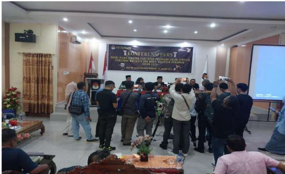
Gambar 3.10 Konferensi Pers Penetapan Pasangan Calon Terpilih Pemilihan Walikota dan Wakil Walikota Pariaman Tahun 2024

Pendidikan Pemilih berupa pelaksanaan Kegiatan Konferensi Pers Penetapan Pasangan Calon Terpilih Pemilihan Walikota dan Wakil Walikota Pariaman Tahun 2024 yang dilaksanakan pada hari Kamis tanggal 8 Januari 2025 bertempat di Aula Rumah Makan Sambalado Kota Pariaman yang dihadiri oleh 30 orang Wartawan.