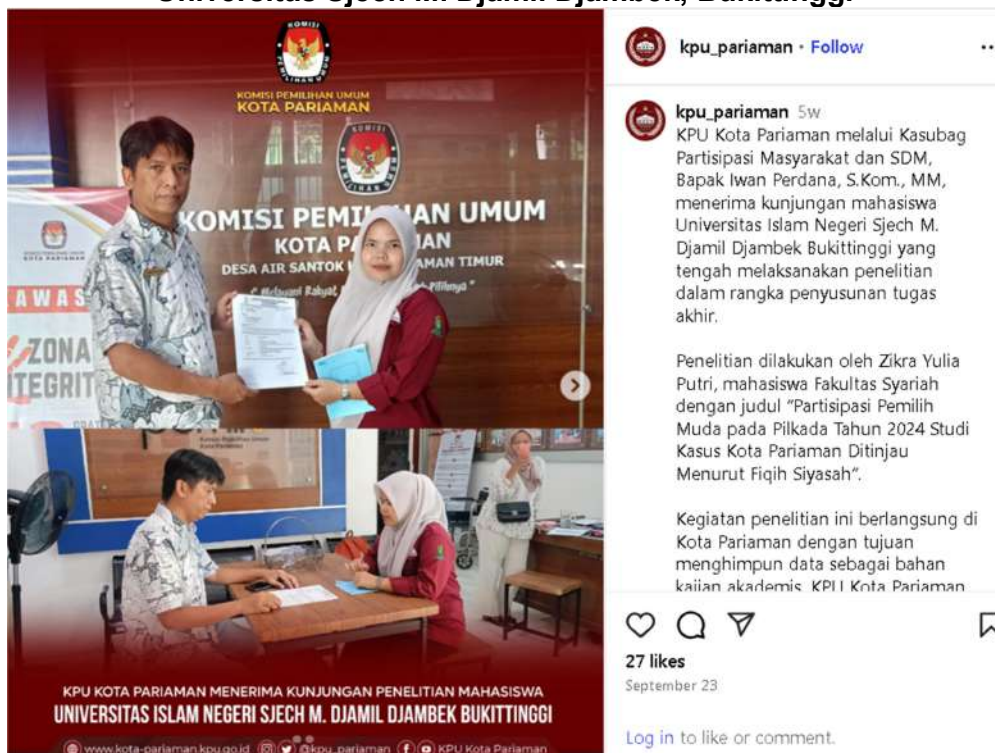
Gambar 3.5 KPU Kota Pariaman menerima kunjungan Penelitian Mahasiswa Universitas Sjech M. Djamil Djambek, Bukittinggi

Kegiatan penelitian ini berlangsung di Kota Pariaman dengan tujuan menghimpun data sebagai bahan kajian akademis. KPU Kota Pariaman berkomitmen memberikan dukungan dan fasilitasi dalam rangka mendukung pengembangan ilmu pengetahuan serta keterlibatan generasi muda dalam proses demokrasi., Sabtu, 20 September 2025.