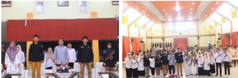
Gambar 3.2 Bimbingan Teknis Panitia Pemilihan Ketua dan Wakil Ketua OSIS SMKN 2 Kota Pariaman

KPU Kota Pariaman berharap agar Pemilihan Ketua dan Wakil Ketua OSIS SMKN 2 Pariaman dapat berjalan lancar dan menjadi pembelajaran berharga bagi para siswa tentang pentingnya demokrasi.