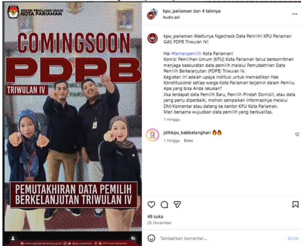
Gambar 3.16 video pendidikan pemilih berupa terus berkomitmen menjaga keakuratan data pemilih melalui Pemutakhiran Data Pemilih Berkelanjutan (PDPB) Triwulan IV

Kota Pariaman. Mari bersama wujudkan data pemilih yang berkualitas. 26 November 2025.