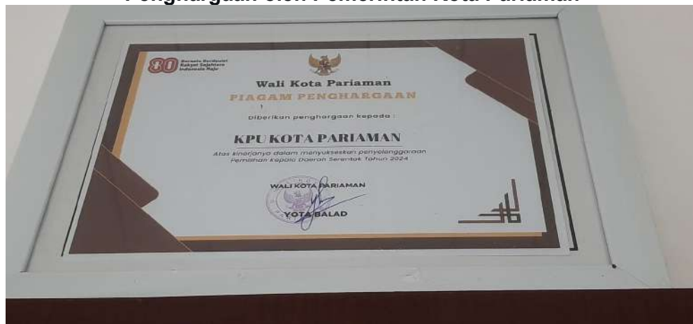
Gambar 3.20 Penghargaan oleh Pemerintah Kota Pariaman

KPU Kota Pariaman pada Tahun 2025 juga mendapatkan Penghargaan oleh Pemerintah Kota Pariaman atas Kinerja dalam menyukseskan Penyelenggaraan Pemilihan Kepala Daerah Serentak Tahun 2024.