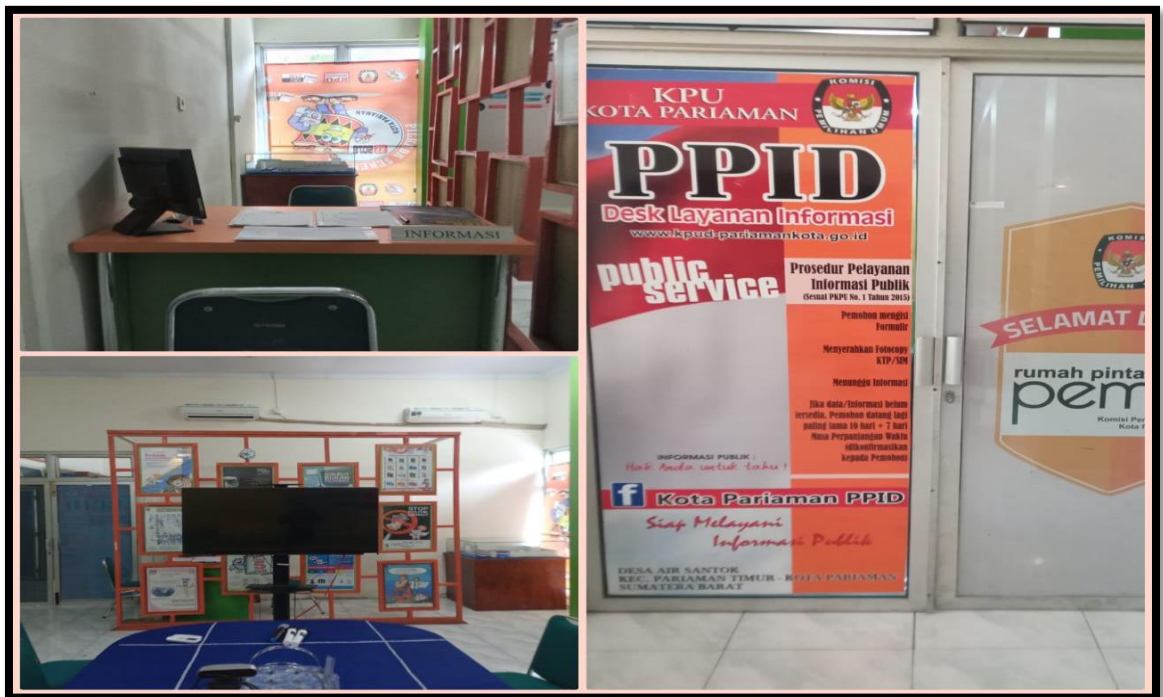
Gambar 1. Ruangan Pelayanan Informasi KPU Kota Pariaman

Pelayanan informasi secara langsung dilakukan melalui Desk pelayanan Informasi dan Dokumentasi KPU Kota Pariaman dengan mengisi Formulir Permohonan Informasi yang telah disediakan. Pelayanan informasi dilakukan pada kantor KPU Kota Pariaman yang beralamat di Desa Air Santok Kecamatan Pariaman Timur. Semua layanan informasi di KPU Kota Pariaman bersifat gratis atau tidak dipungut biaya, kecuali apabila terdapat biaya penggandaan informasi yang menjadi tanggung jawab pemohon informasi. Untuk permohonan informasi pemohon juga dapat diarahkan untuk melihat ke space selasar Informasi Rumah Pintar Pemilu, untuk melihat data yang sudah tertempel di space papan Data Informasi, bisa juga ke Perpustakaan KPU Kota Pariaman.