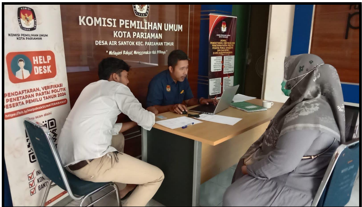
Gambar 3. Pelayanan Klarifikasi Tanggapan Masyarakat terhadap Keabsahan Dokumen Persyaratan Partai Politik

Selama Tahun 2022 KPU Kota Pariaman sedang melaksanakan beberapa Tahapan Pemilihan Umum Tahun 2024, sehingga cukup banyak pemohon informasi yang langsung datang ke Kantor KPU Kota Pariaman. Adapun pemohon informasi sejumlah 43 (empat puluh tiga) orang, baik yang datang secara langsung ke kantor KPU Kota Pariaman, atau melalui email. Cukup banyak pemohon informasi yang datang di KPU Kota Pariaman pada Tahun 2022 yang hanya memohon informasi dan dokumentasi serta berkoordinasi mengenai tahapan pelaksanaan Pemilihan Umum 2024 atau pemohon informasi yaitu dari Partai Politik yang membutuhkan data hasil Pemilu di Tahun 2019.